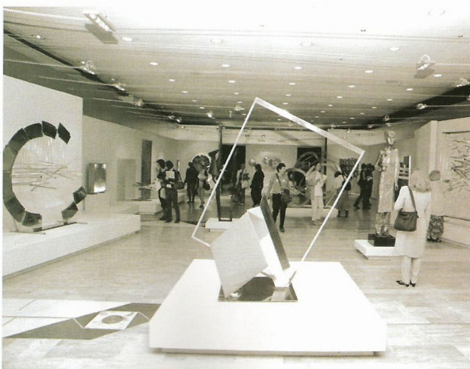
πάνω: Το έργο Φακός με ομπρέλες μέση: Το υπαίθριο γλυπτό στο Ζάλογο κάτω: Γενική άποψη της έκθεσης